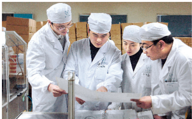
集团生产车间QC小组成员讨论技改项目

近年来，扬子江药业集团以科学发展观为指导，以振兴民族医药工业为己任，坚持自主创新、质量强企“双轮驱动”，企业发展驶入快车道。扬子江药业集团继2005年率先在全国医药工业企业中产销突破百亿元大关后，自2009年起，连续4年跻身全国医药工业百强榜前三甲，成为民族医药工业的一面旗帜。