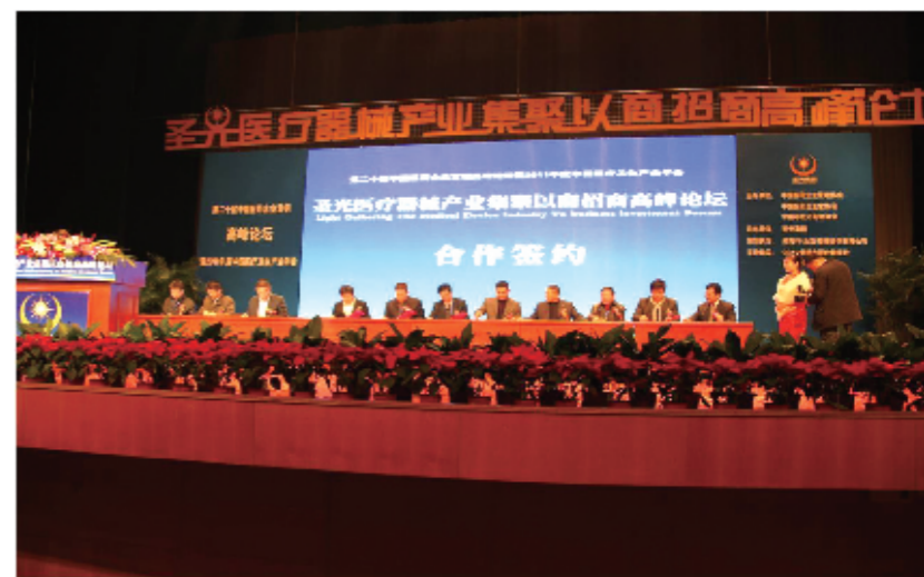
孵化园以商招商论坛现场