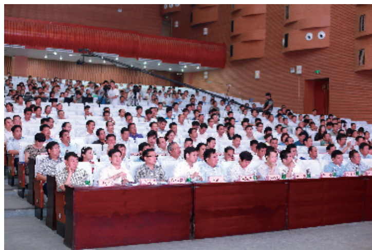
圣光集团“八五—五战略工程”会议现场