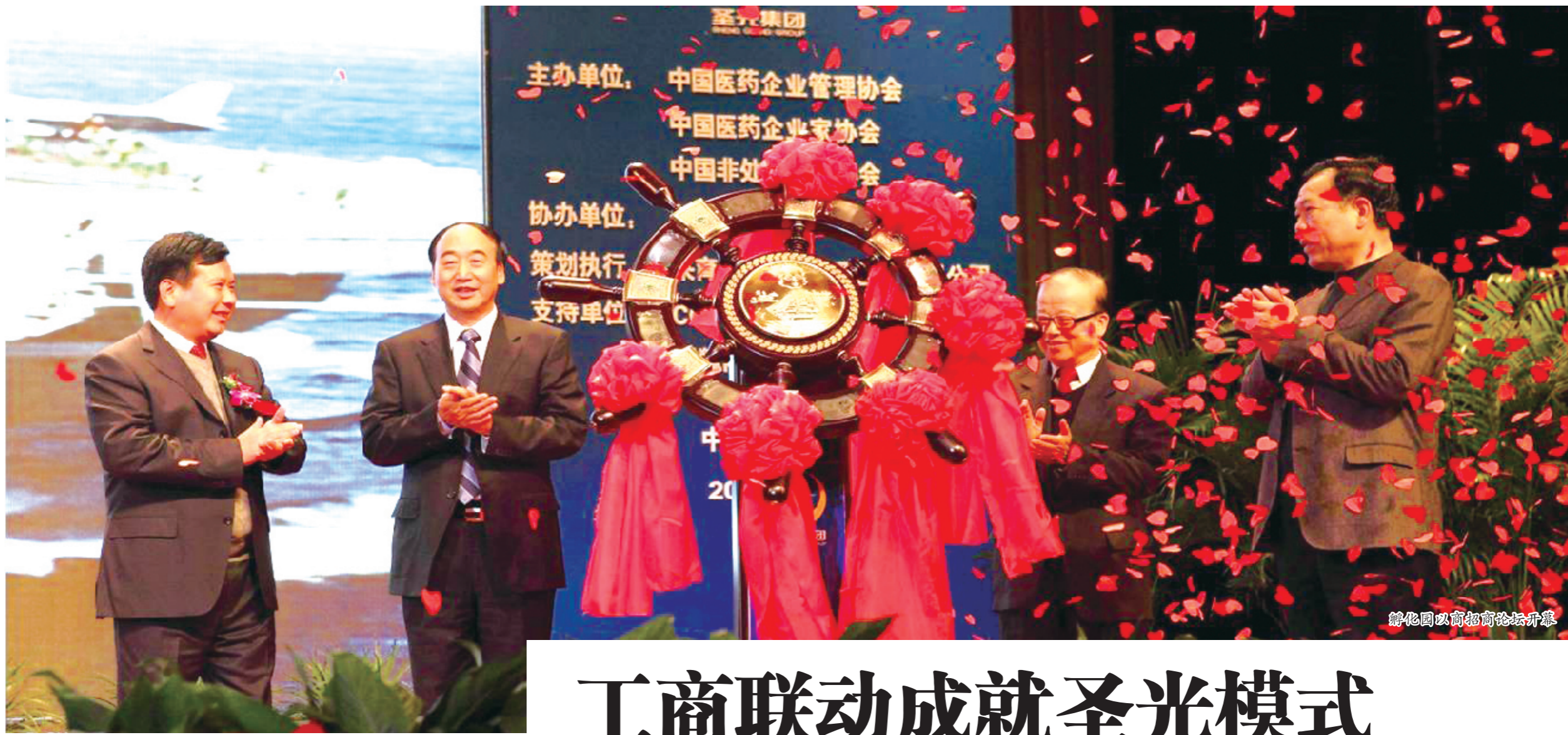
孵化园以商招商论坛开幕