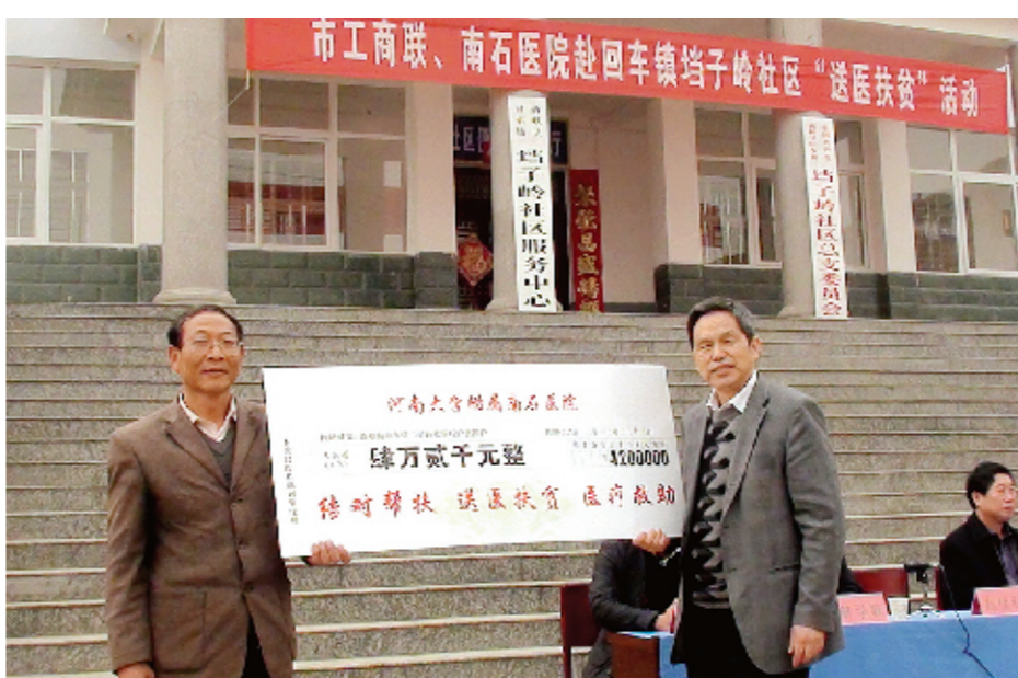
向峡县县子岭村贫困村民捐款