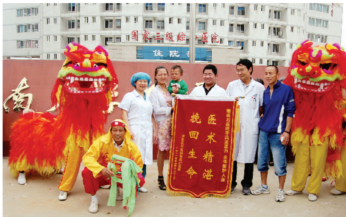
患者向南阳南石医院赠送锦旗

用心服务,因病施治;医德高尚,仁心仁术。随着“三好一满意”活动的不断深化,南阳南石医院以过硬的医疗技术,充满爱心的公益行动,在“质量好、服务好、医德好,群众满意”的目标中连续多年获得“大满贯”,也谱写了一曲“救死扶伤”之歌,并在老百姓的赞誉中乘风正帆,向着更高更远的目标阔步前进!