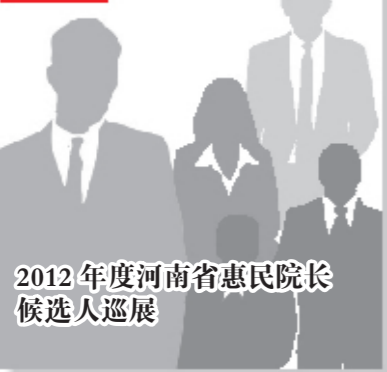
2012年度河南省惠民院长候选人巡展

从来没有哪个时期比现在更接近梦想！经过几十年的发展，宁陵县人民医院已经发展成为一所集医疗、急救、教学、科研、预防为一体的综合性医院。该院开设有内、外、妇、儿、骨、五官、中医内外、急诊、放射、检验、心电、脑电、超声、胃镜等科室40个，为当地百姓的健康撑起了一片绿荫。