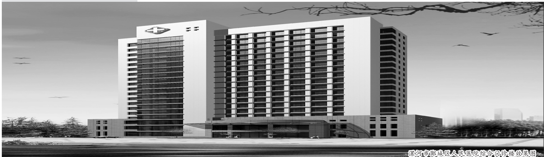
漯河市郾城区人民医院综合门诊楼效果图