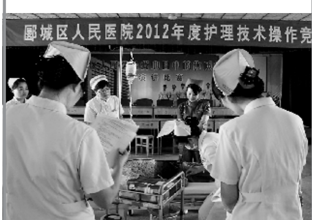
护理技术操作竞赛