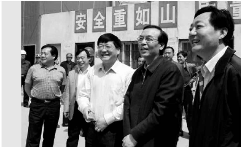
漯河市委书记马正跃在该院新病房楼施工现场调研