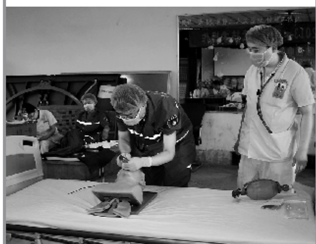
心肺复苏技能比武