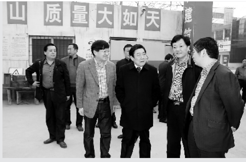
漯河市市长曹存正在该院新病房楼施工现场指导工作