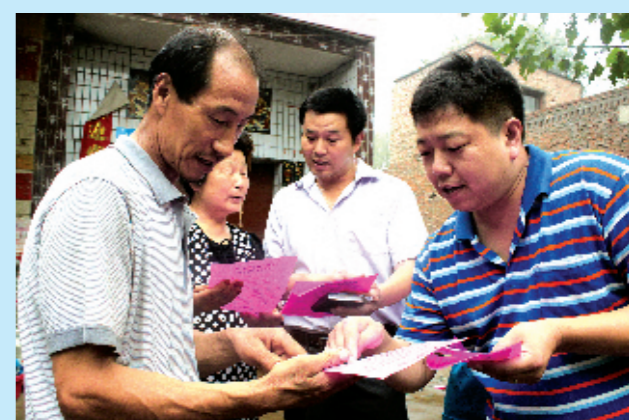
走村入户宣传新农合政策

如今,肩负着保护全市人民群众健康重任的汝州市第一人民医院,本着“厚德博学,严谨求精”的医院精神,一如既往地发挥综合性医院在疑难危重症的诊疗、医学教育、科研、指导、培训等方面的作用,忠于职守,践行“推动科学发展、促进社会和谐、服务人民群众”的理念,用一腔热血和汗水描绘汝州市卫生事业的美丽画卷,为实现汝州市卫生事业跨越式发展谱写新的壮丽篇章!