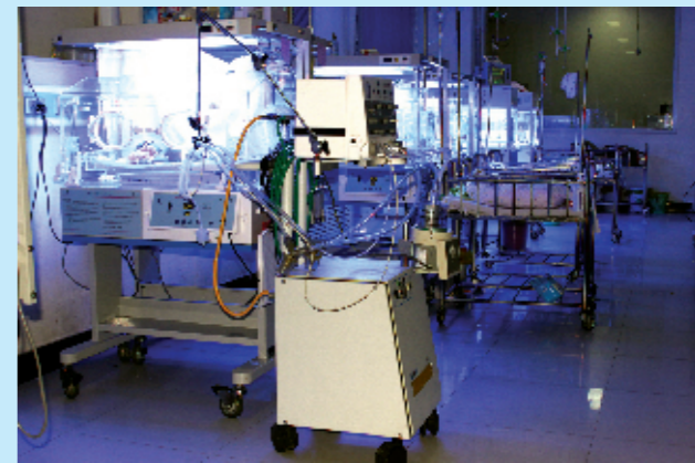
新生儿重症监护室