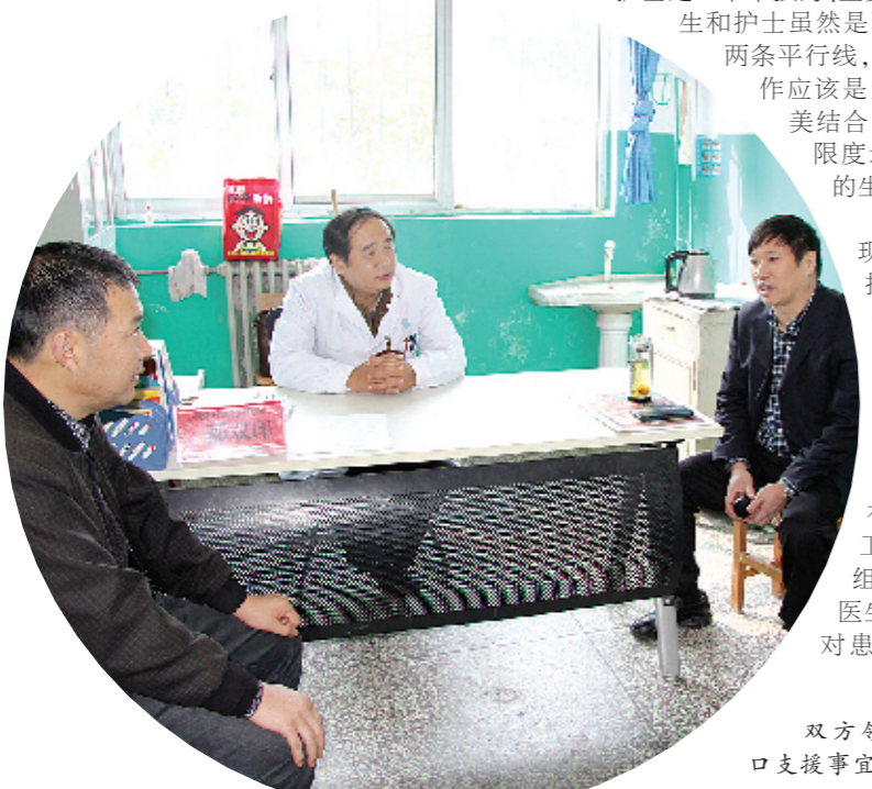
双方领导交流对口支援事宜