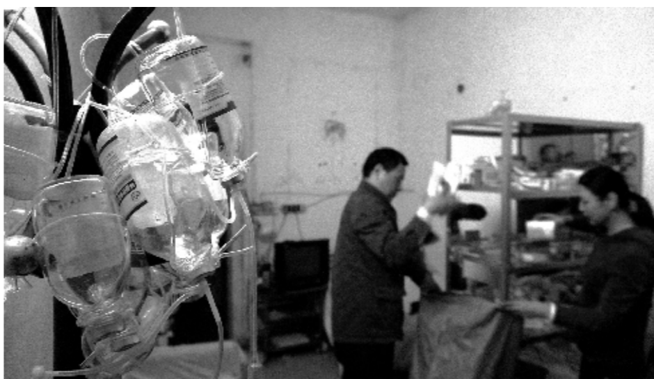
黑诊所输液架上挂满了液体瓶

门头悬挂的灯箱上印着“主营业务:镶牙、拔牙、补牙”的一家诊所,脏乱异常,只有黑乎乎的发沙和一台简易的设备。“这是食品储藏柜,他却用来储存药品和医疗用品。”执法人