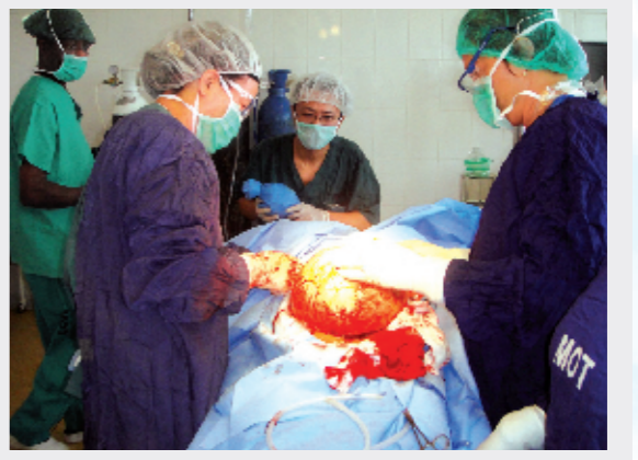
中国援赞比亚医疗队妇产科医生和麻醉师合作为一个赞比亚妇女切除9.5千克子宫肌瘤