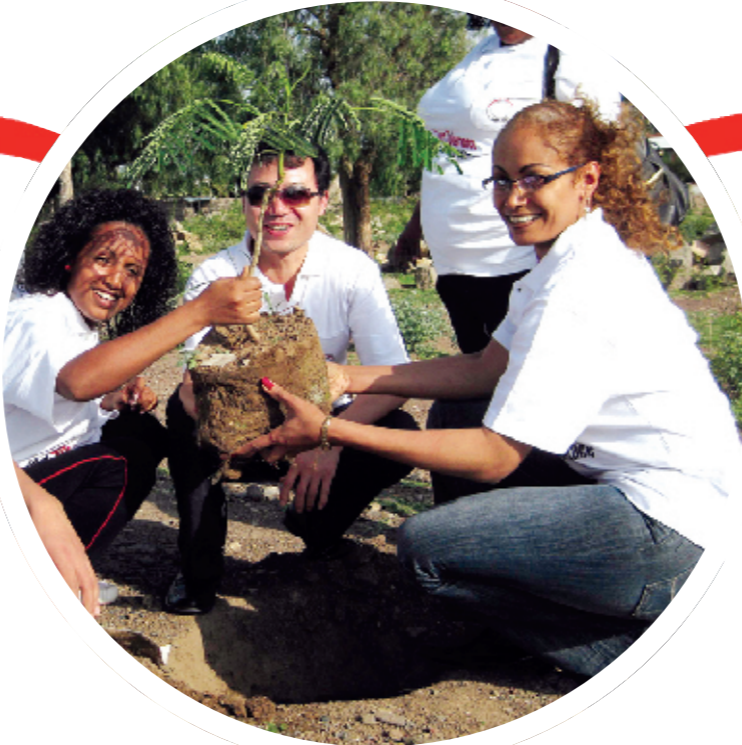
中国援埃塞俄比亚医疗队队员与受援国同事共同栽下友谊树