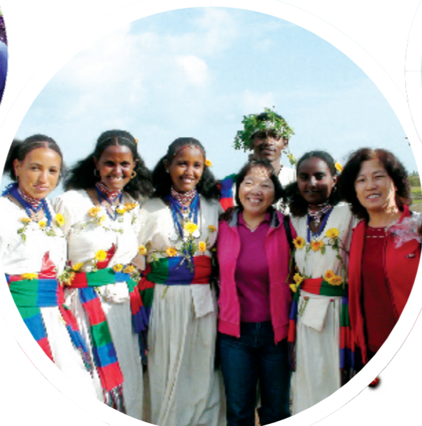
中国援厄立特里亚医疗队队员和受援国群众一起欢度厄特传统佳节

40年,他们像候鸟一样,年复一年,在欧亚大陆与非洲大陆间往复; 40年,他们跨越国界、跨越种族无私援助,从未间断…… 医者行医,不仅医治患者孱弱的躯体,而且抚慰无助的心灵,无论贫贱富贵,不分国界种族。 自1973年开始承担援外医疗队组派任务以来,我省选派一批又一批医疗队员,他们的足迹遍布埃塞俄比亚高原,汗水挥洒在赞比西河畔。40年来,他们诊治受援国群众600多万人次,实施各类手术近10万例,不仅成功救治了很多疑难重症患者,而且圆满完成了受援国高层及我国驻受援国使节的医疗保健任务。