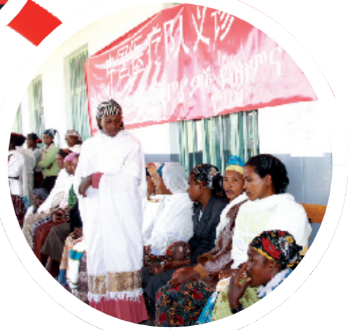
中国医疗队义诊现场