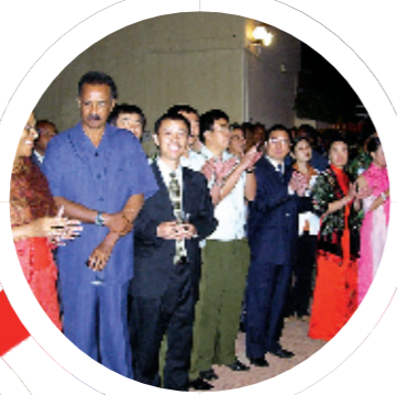
厄立特里亚总统伊萨亚斯和中国援厄特医疗队队员出席我驻厄特使馆举行的国庆晚宴