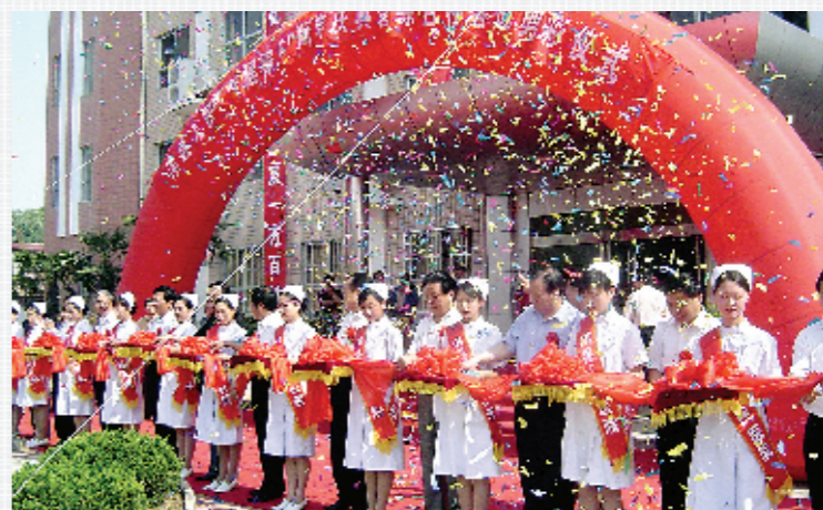
举行建院60周年院庆