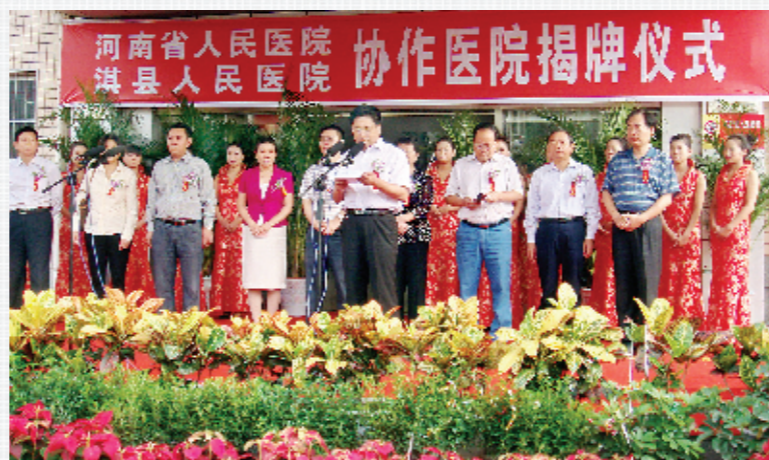
与省人民医院结为协作医院