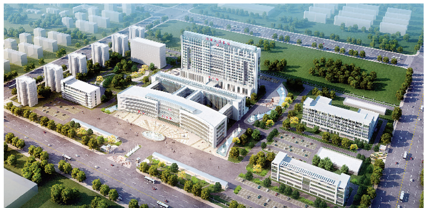
淇县人民医院鸟瞰图