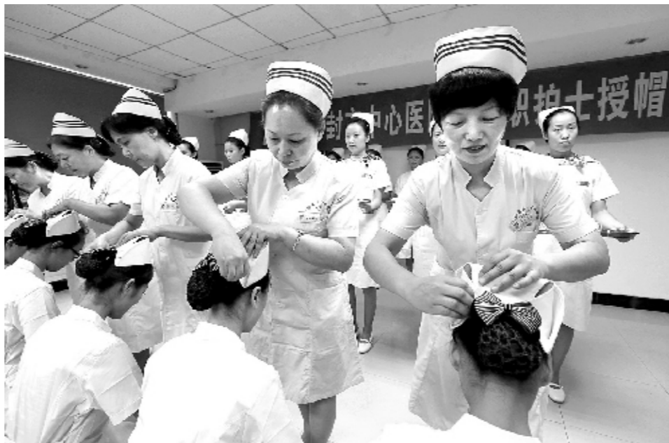
8月26日,一群刚走出校门、志在奉献的“天使”在开封市中心医院全体护士长的见证下,参加了授帽仪式,标志着她们正式跨入救死扶伤、关爱健康的护理行业。