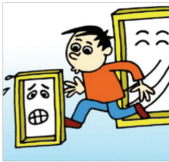
跑跑跳跳浑身轻,好吃懒动多生病。 王晓东/画