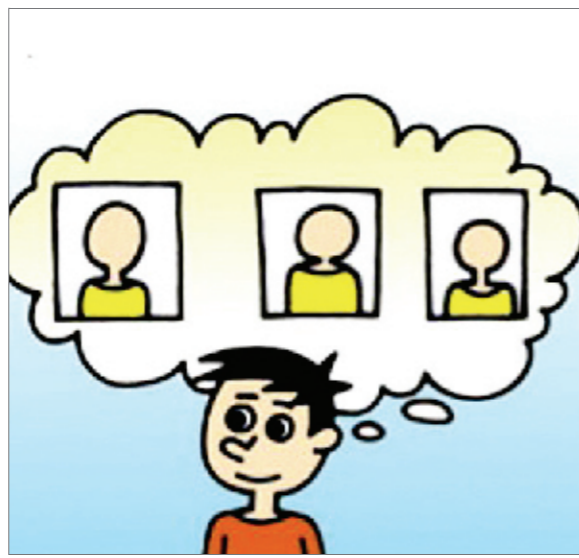
良好的健康状况,恬淡的愉悦心情,是幸福的最宝贵财富。 王晓东/画