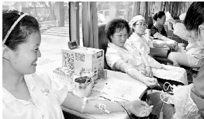
近日,鹤壁市中心血站的采血车开进了鹤壁总院,该院职工纷纷进行无偿献血。当天上午,有69名医务人员献血,总献血量达27400毫升。

光山县“医纠办、医调委”挂牌成立后,将坚持预防为主的工作方针,有效预防和及时化解医疗纠纷,改善医患关系;通过非诉讼调解的方式,为医患双方提供一个沟通、协商的公益性服务平台。