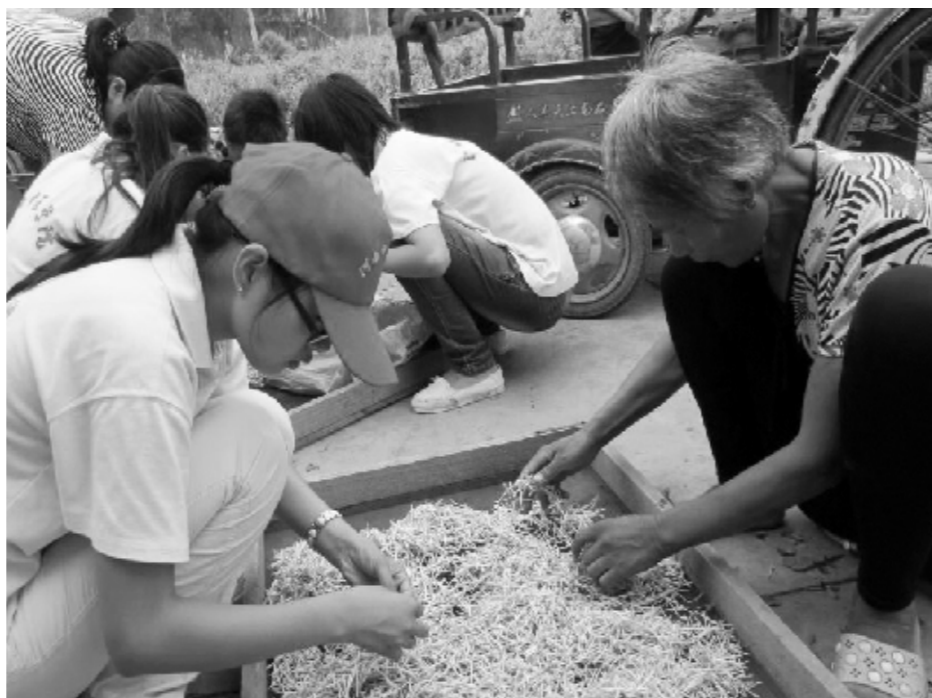
连日来,河南中医学院多支“三下乡”暑期实践小分队分赴全省各地开展送医、送药和科技支农活动,受到当地群众热烈欢迎。图为该校大学生在帮助药农晒制药材。

本报讯(记者 王明杰 通讯员 易淑国 杨海燕)近日,商城县食品药品监督管理局结合全县食品药品工作实际,开展食品药品安全专项整治工作,推进全县食品药品监管各项工作的落实。目前,该局已完成了对全县76家餐饮服务单位和学校食堂的量化分级工作;抽检药品125个批次(其中抽检基本药物72批次),办理举报投诉90起,协查核查51起,移交司法机关3起,案件回复率、协查回复率均达100%。