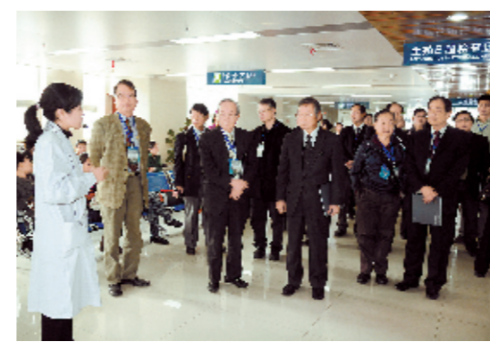
台湾专家听取郑州大学一附院生殖中心情况介绍