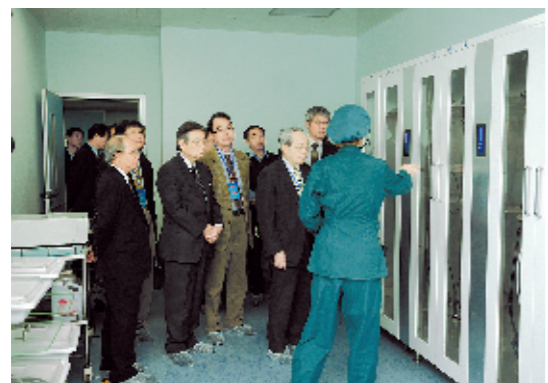
台湾专家参观河南省人民医院内镜中心

“这是在全省深化医药卫生体制改革攻坚阶段召开的一次重要盛会。希望通过这次交流,汲取宝岛台湾同仁追求卓越的技术品质以及国际化的发展理念、现代化的管理理念、人性化的服务理念,相互交流,相互提高,共同发展医疗卫生事业,共同开创发展新局面。”省卫生厅厅长刘学周表示。