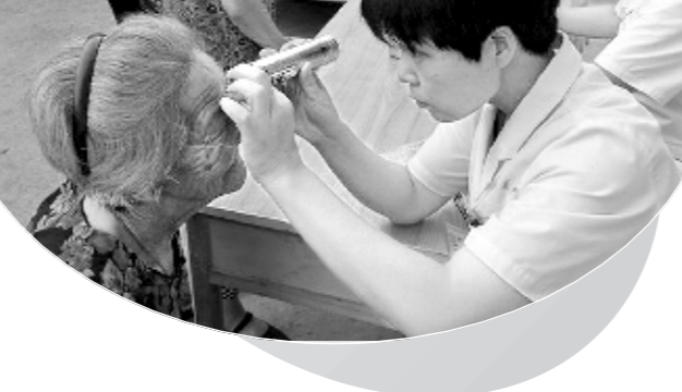
伊川县高度重视白内障患者复明工作,认真开展白内障患者普查、筛查工作,在伊川县卫生学校附属医院免费治疗。