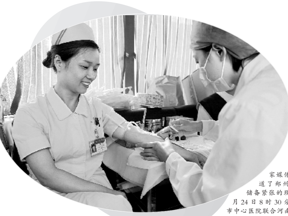
在多家媒体相继报道了郑州市血液储备紧张的现状后,8月24日8时30分,郑州市中心医院联合河南省红十字血液中心,组织全院医务工作者在该院门诊广场举行无偿献血活动。

本报讯(记者 王正勤)日前,焦作市政府纠风办公室、焦作市职务犯罪预防办公室和焦作市卫生局联合下发通知,对全市医疗卫生机构药剂、器械管理和采购人员进行定期轮岗。