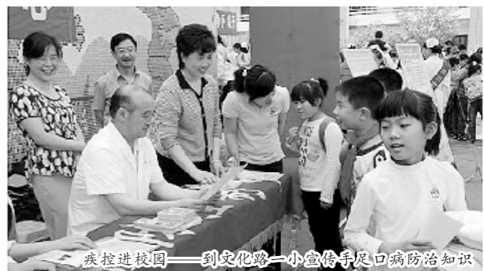
疾控进校园——到文化路一小宣传手足口病防治知识

同时,郑州市疾病预防控制中心还成立了行风建设宣传报道组,对社会关注度较高的重大工作、重点疾病、重要会议、重要节日或突发性事件,采用召开新闻发布会、提供新闻通稿等形式,及时向社会通报情况;并通过先进典型的宣传报道,使每位职工行动有标尺、心中有标杆,有力地推动了政风行风工作。