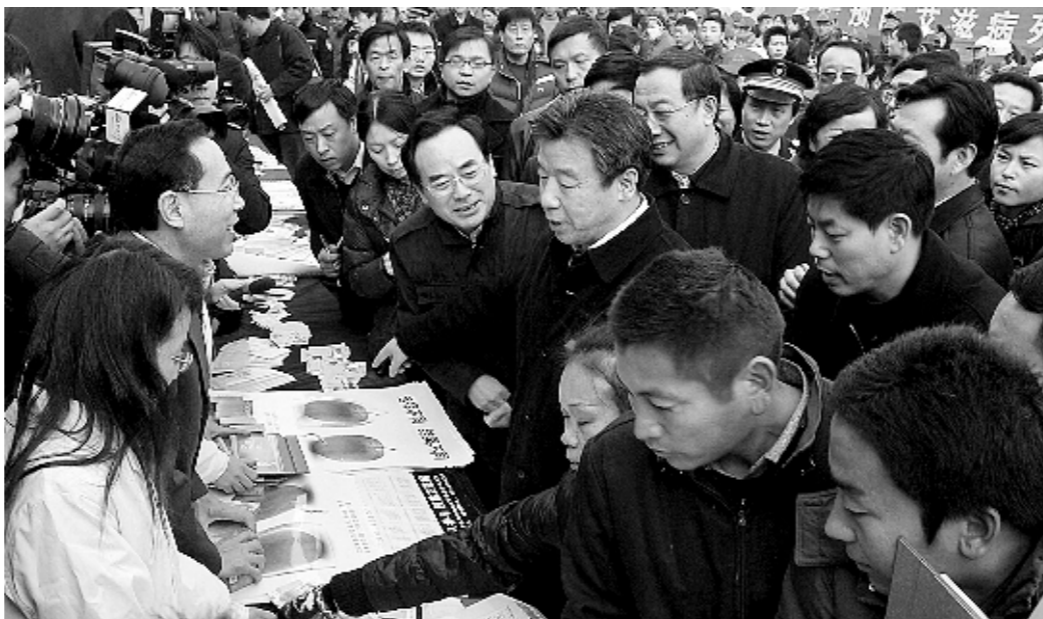
河南省委书记卢展工,省卫生厅厅长刘学周等在艾滋病防治宣传活动现场

扎扎实实地防控疾病,在公共卫生突发事件中担当“公共卫生兵”,并且倡导健康的生活方式……郑州疾控人成为名副其实的健康使者。这是郑州市疾控中心以为民服务为导向,全力推进政风行风建设的缩影。正是围绕真心诚意为民服务的目标,建立人人履行岗位职责的机制,塑造了疾控系统广受社会认可和好评的良好形象。