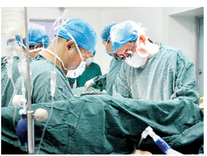
吴清玉教授与陈兴澎博士同台实施手术

7月2日上午,洛阳市中心医院心脏外科迎来了发展史上的一件大事,国家级心脏外科泰斗、清华大学第一附属医院院长吴清玉教授正式加盟,成为洛阳市中心医院名誉院长、心脏外科技术顾问,将定期到洛阳市中心医院进行技术指导、讲学,并亲自参与、指导各种心脏外科疑难手术。 吴清玉教授现任清华大学第一附属医院院长及心脏中心主任、清华大学医学院副院长,为清华大学学术委员会副主任及博士生导师、中央保健会诊专家,现为内地目前唯一的亚洲心胸血管外科学会常委、美国胸外科学会(AATS)会员、欧洲心胸外科学会会员和美国《胸外科年鉴》中国大陆编委,是美国胸外科医师学会(STS)会员、中国医师协会心血管外科分会副会长、国务院学位委员会学科评议组成员、国际欧亚科学院院士。 吴清玉教授从事心血管外科临床和相关基础研究30余年,在冠心病、先天性心脏病、心脏瓣膜病、大血管疾病、婴幼儿复杂心脏畸形、人工左心辅助等领域均有很高造诣;在理论和临床上解决了多项国内外心脏外科诊治难题,特别是疑难复杂冠心病、危重晚期冠心病等的手术疗效居世界领先水平,为国内外同行所认可;在国内率先开展了心房里室双调转等13项高难度心脏手术,作为手术操作者和指导老师已成功治愈了上万名患者;5次应邀美国专家邀请赴国外手术示范;主持完成的科研项目获国家级、卫生部和北京市级奖14项(其中有7项排名第一);发表论文250余篇,SCI(科学引