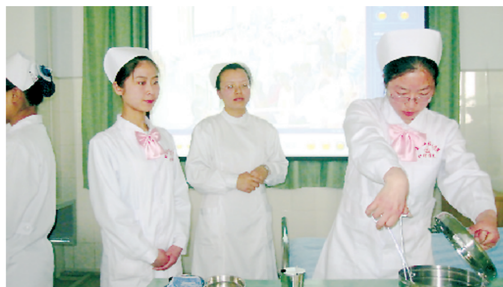
鹤壁职业技术学院护理学院的老师正在指导学生进行护理技能操作

李希科认为，高校的办学目的最终应落实到人的全面发展上。针对眼下一些过于强调技能培养而忽略人的全面发展的做法，李希科表示：“学生不是产品，在培养过程中要注重学生综合素质的提高。”