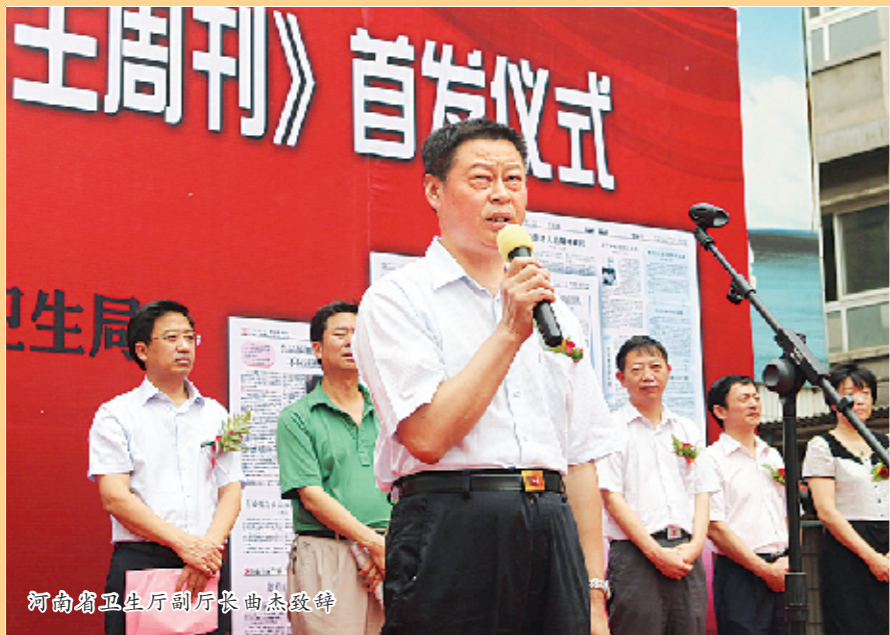
河南省卫生厅副厅长曲杰致辞