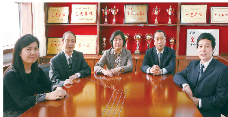
团结奋进的领导班子