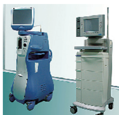
美国爱尔康 Legacy Everest 及 Infiti 白内障超声乳化仪