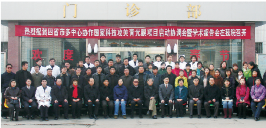
四省市多中心协作国家科技攻关青光眼项目启动协调会暨学术报告会在安阳市眼科医院召开

安阳市眼科医院 电话:(0372)3679002(咨询)(0372)3679004(急诊) 邮箱:aysyky@126.com 网址:www.anyangeye.com 邮编:455000 地址:安阳市文明大道东段 乘车线路:7、17、19、29、36路