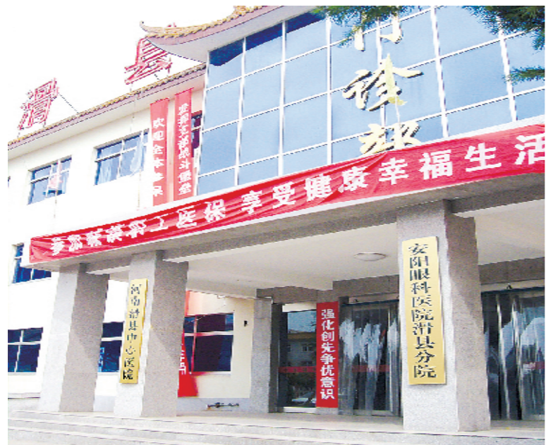
安阳市眼科医院滑县分院