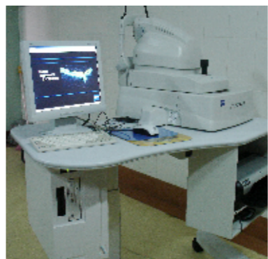
德国蔡司光学相干断层扫描仪(OCT)