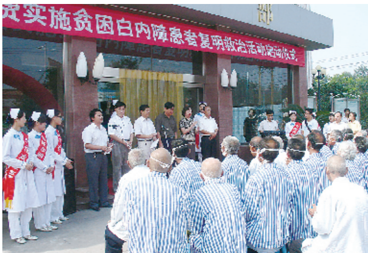
贫困白内障患者复明救治活动启动仪式