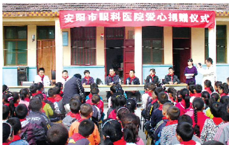
深入山区关爱农民工子女