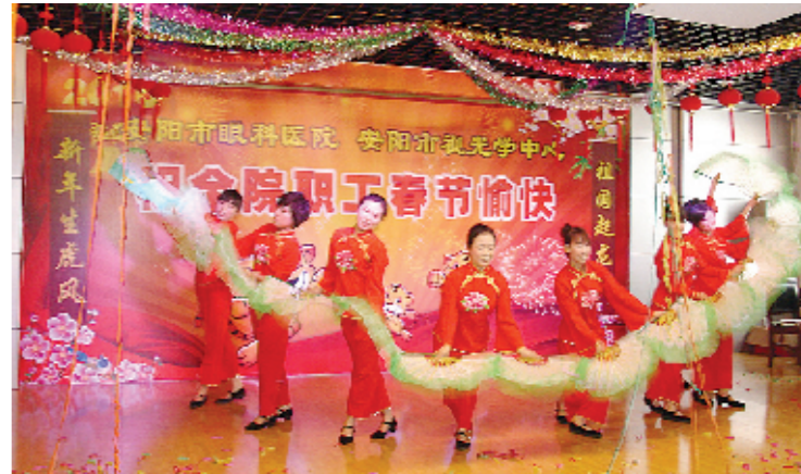
丰富多彩的文化生活