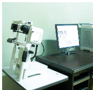
德国海德堡视网膜断层扫描仪(HRT-III)