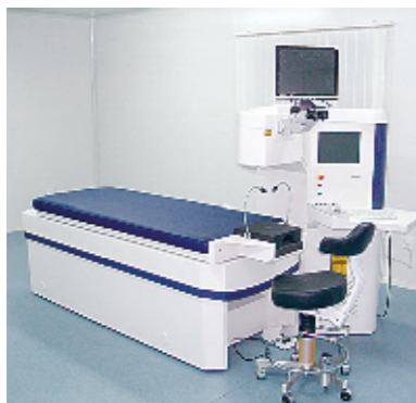
美国博士伦 217Z100 准分子激光治疗仪