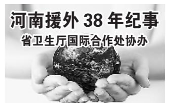
河南援外38年纪事 省卫生厅国际合作处协办

医生的职责就是给患者看病,我只是尽了自己应尽的义务,并没有多干什么,就得到一位老人的感谢。我被感动了,心灵受到了一股暖流的冲击。