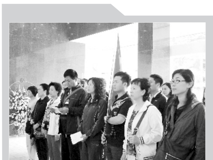
近日,河南省医学会全体职工前往革命圣地井冈山接受革命传统教育。

阿瓦汗·热杰甫表示,此次调研交流机会难得,考察团成员大部分是来自新疆生产建设兵团农十三师卫生系统的卫生行政管理部门、卫生监督所、疾病预防控制中心、医疗单位的负责同志,此次来河南学习参观,河南省卫生厅卫生监督局是第一站。河南卫生行政执法队伍的精神风貌,给考察团一行留下深刻印象,他们希望今后能够加强沟通,采取“引进来、走出去”的模式,加大合作力度,建立交流机制,全面促进对口支援工作。