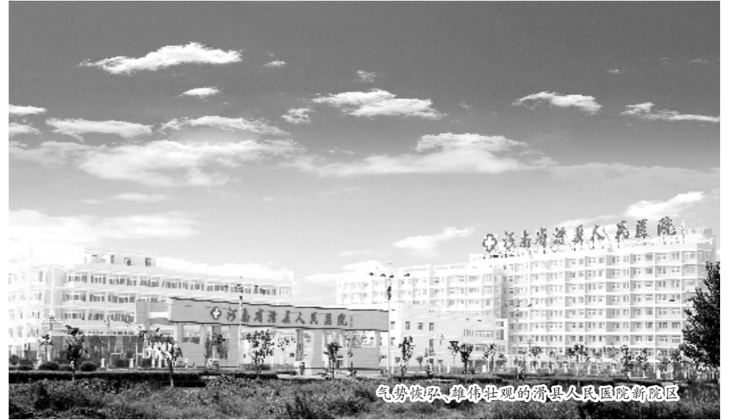
气势恢弘、雄伟壮观的滑县人民医院新院区

院长接待室和院长信箱,公开了投诉电话,对患者反映的问题和意见,积极协调处理,限时办结。与此同时,滑县人民医院还出台了医患沟通制度,将昂贵药品及高值耗材的使用、特殊检查、手术方式等情况告知患者,切实做到合理检查、合理用药,减轻患者的经济负担。