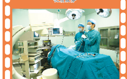
飞利浦心血管造影机