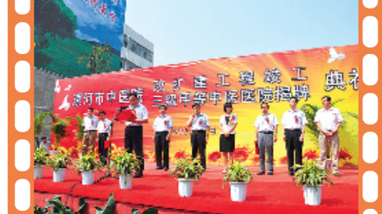
改扩建工程竣工,三甲医院揭牌典礼