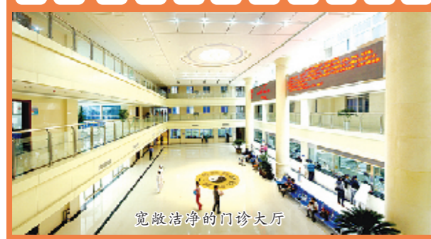
宽敞洁净的门诊大厅