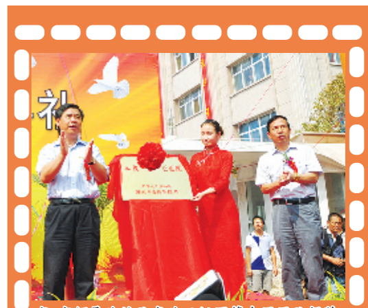
省、市领导为该院成为三级甲等中医医院揭牌

物竞天择,适者生存。如今,漯河市中医院的发展蓝图又开始了新的描绘,该院将在巩固三级甲等中医医院成果的基础上,朝着建设全国示范中医院、全国文明单位的目标继续拼搏,铿锵前行!漯河市中医院将迎来更加美好的明天!