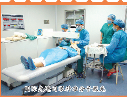
国际先进的眼科准分子激光