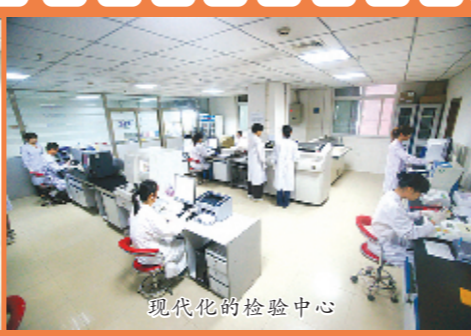
现代化的检验中心