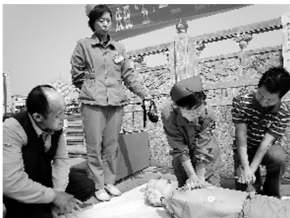
↑5月15日是全国第二十个助残日,中国平煤神马集团一矿职工医院的青年志愿者组成医疗服务队,来到平顶山市特殊教育学校,为聋哑儿童义诊。