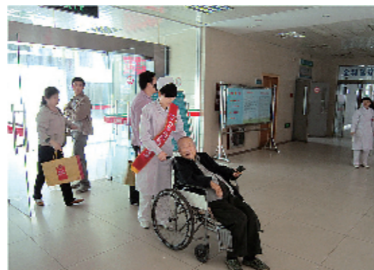
安阳地区医院的年轻职工组成志愿者服务队,经常利用休息时间,护送患者就诊、陪同患者检查。图为5月4日志愿者帮助患者推轮椅。