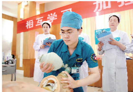
5月11日,在河南省人民医院南住院部12楼,一群白衣天使在一丝不苟地忙碌着。河南省人民医院用“青春五月”护理人员技术大比武活动,向建党90周年献礼。