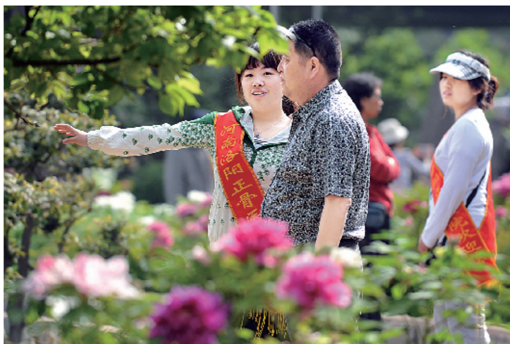
洛阳第二十九届牡丹花会期间,洛阳正骨医院与河南职工医学院联合培养的第三届护理教改班的40名学生,利用休息时间走进各个牡丹公园,向外地游客介绍洛阳牡丹的传说、花色品种、药用价值等,同时积极配合公园的工作人员维持秩序,保护美丽的花朵。