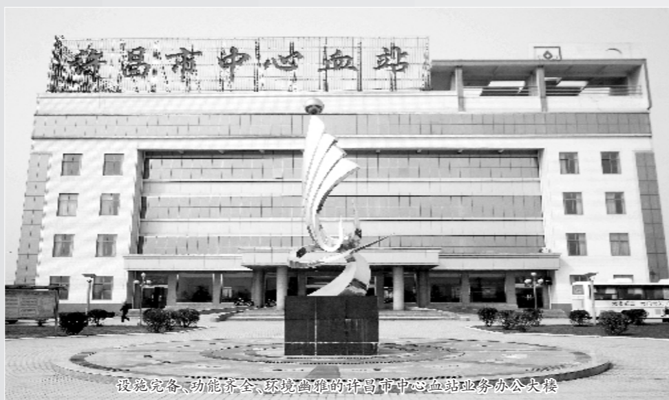
设施完备、功能齐全、环境幽雅的许昌市中心血站业务办公大楼

这是一个光环耀眼的集体，先后5次被卫生部、中国红十字会授予“全国无偿献血先进城市”荣誉称号；2004年被许昌市人民政府评为绿化先进单位，2007年荣获“市级文明单位”称号；2008年体采科被授予“许昌市巾帼文明岗”荣誉称号；2009年被省爱国卫生运动委员会授予“省级卫生先进单位”、“省级文明单位”，以及“省级档案管理先进单位”、“全省采供血服务体系