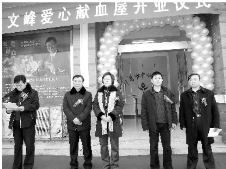
文峰献血屋举行开业仪式