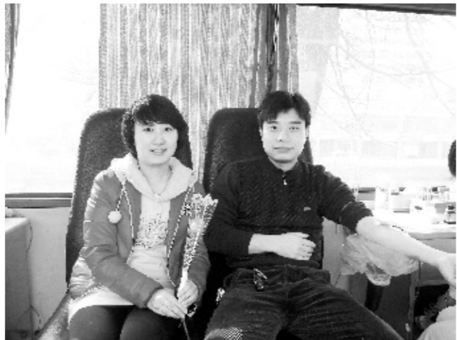
在情人节那天，一对情侣走上了流动采血车，并捐献血液

作者的风采，他们的生活也因奉献而色彩斑斓！许溯华夏千古都，昌临故土今日城。如今，中华文明的发源地，献血爱心的传承人，13年的风雨历程，许昌市中心血站默默奉献着他们的一片爱心，记载着“血站人”艰辛的创业历程，凝聚着“血站人”无穷的智慧和力量，更展示了“血站人”孜孜不倦的本色和风采。世界因爱而美好，焕发着勃勃生机的许昌市中心血站正在以最美丽的姿态走向辉煌！