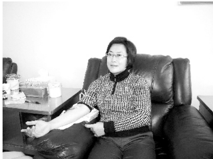
许昌市副市长秦春梅参加无偿献血

大厅、采血大厅、休息大厅、发血室、免疫实验室、百级大型净化间、成分制备室、贮血库、质控工作室、微机中心、图书阅览室、综合档案室、活动室、学术报告厅、地能中央空调等一应俱全。进口全自动酶免筛查系统、专用贮血冰箱、Trima和MCS+血细胞分离机、大容量低温离心机、血细胞计数仪等60余台先进设备为血液质量提供着强大的技术支持。13年的风雨历程，许昌市中心血站见证了全市输血事业的发展历程。他们用事实、业绩、用形象、用情感把许昌市中心血站凝聚成了一个生机勃勃、团结和谐的整体；他们在平凡的岗位上留下一串串充满爱心的足迹，为全市460万人民的用血安全保驾护航。